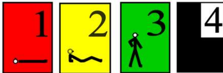
Vzory štítků (místo štítků mohou být použity plastické barevné pásky upevněné na rukou):